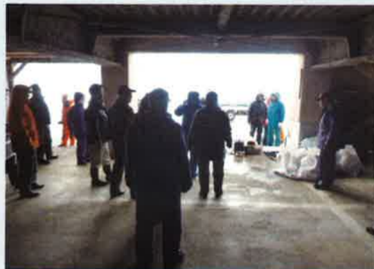
4/9 春の空き缶拾い 鶴川地区の道路を空き缶やゴミを拾