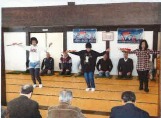
3/11 綾子舞 扇ひらき 今年も綾子舞の春の恒例行事を