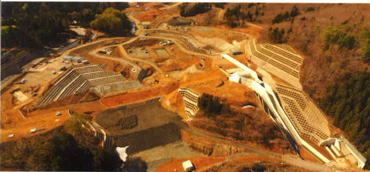
工事現場全景(上空より撮影)

場内の除雪が4月の中旬に完了し、冬季に撤去していた場内安全設備の復旧、遮水性材の乾燥設備の準備等を行い、4月21日から堤体の盛立を再開しています。